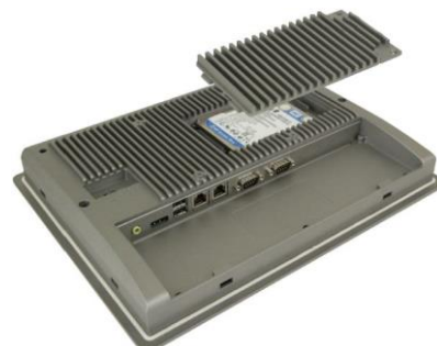
Доступ к SSD / HDD