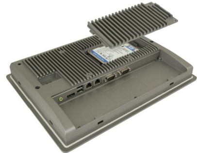
Доступ к SSD / HDD