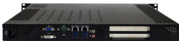
Вид сзади (AC-версия)